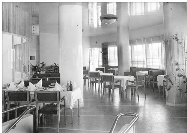
Ravintolan alkuperäinen sisustus oli Alvar Aallon käsialaa.

Ilmailun ihme innoittaa kuitenkin yhä uusia sukupolvia. Malmin lentoasemaravintolan suurista ikkunoista avautuva esteetön näköala lentokentän liikennealueelle on yhtä hieno kuin aina ennenkin, ja sen ansiosta ravintola tarjoaa pääkaupunkiseudulla kaikille ilmailusta kiinnostuneille lähibussiyhteyden päässä sijaitsevan, täysin mukavuuksin varustetun aitiopaikan vireän lentotoiminnan seuraamiseen.