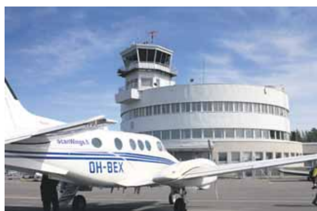
King Airilla koulutetaan liikennelentäjiä.

SL Flight Training tekee kiinteää yhteistyötä ScanWings -liikelentoyhtiön kanssa. Beechcraft King Air C90 -potkuri-turbiinikoneella lennetään sekä koululentoja että mm. tilaus- ja ambulanssilentoja.