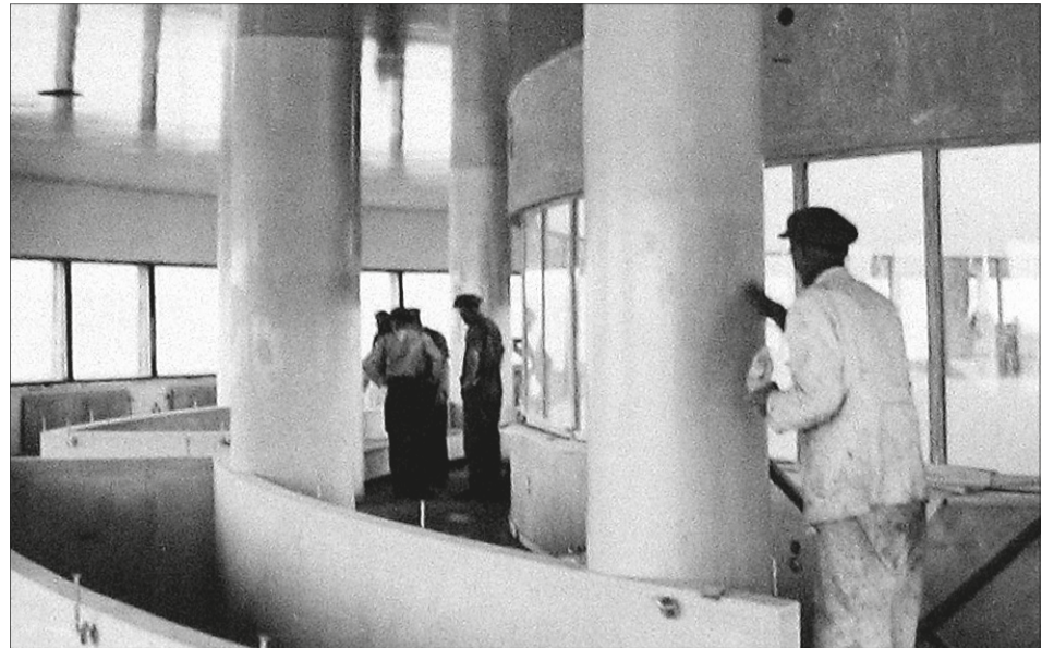
Ravintolan sisätyöt edistyivät keväällä 1938.