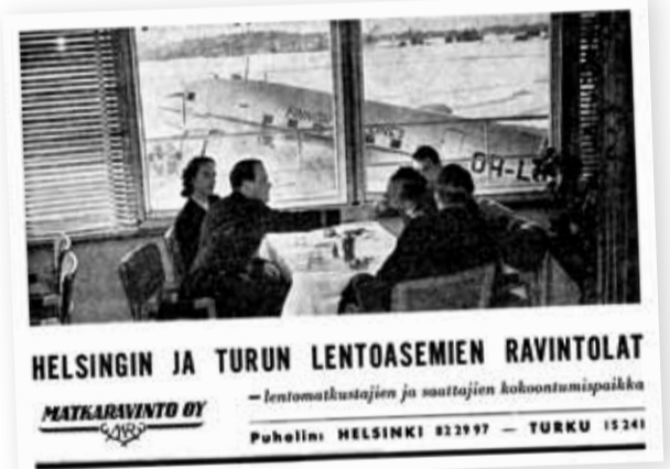
Matkaravinto Oy mainosti palvelujaan Ilmailu-lehdessä huhtikuussa 1950.

Teksti: Seppo Sipilä ja Hannu-Matti Wahl