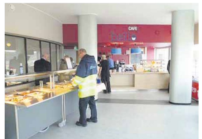
Hello Cafen päivittäinen lounaslista löytyy netistä.

– Ravintola on saanut paljon hyvää ja kehittävästä palautet-