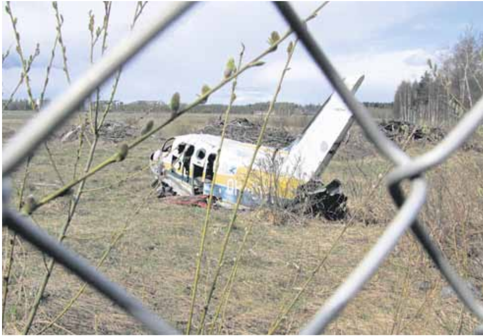
Koneen hylkykin on ollut kentällä hyötykäytössä.

Suomen luonnonsuojeluliitto ry on moneen otteeseen lausunnoissaan vastustanut Malmin lentokentän siirtohanketta. Samalla kannalla on paikallinen lintuyhdistys MaTaPuPu Birding Society.