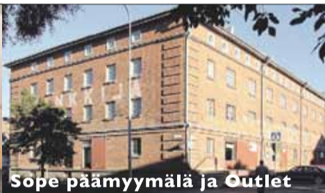
Sope päämyymälä ja Outlet