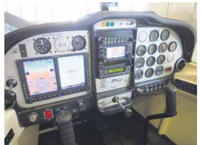
Uusien koulukoneiden mittaristo on samantyyppinen kuin mitä käytetään uusissa matkustajakoneissa.

Teksti: Tero Auranen, Raine Haikarainen Kuvat: Patria, Raine Haikarainen